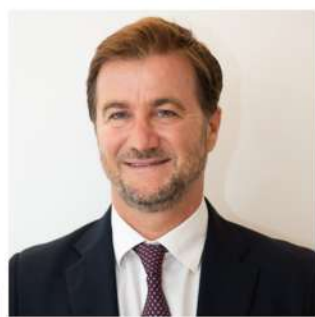
MARCO DE GIORGI CONSIGLIERE DI RUOLO DELLA PRESIDENZA DEL CONSIGLIO DEI MINISTRI