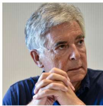
CLAUDIO MARTELLI DIRETTORE DEL GIORNALE AVANTI EX VICE PRESIDENTE DEL CONSIGLIO DEI MINISTRI