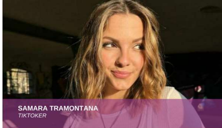
SAMARA TRAMONTANA TIKTOKER