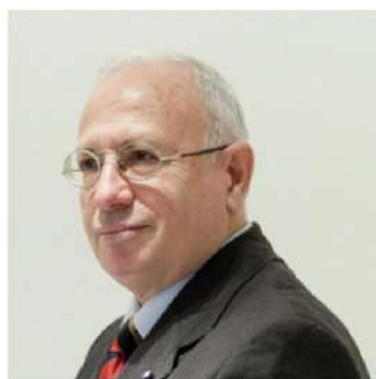
FABIO MINI GENERALE DI CORPO D'ARMATA CAPO DI STATO MAGGIORE DEL COMANDO NATO