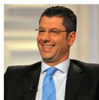
GIUSEPPE SCOPELLITI EX PRESIDENTE DELLA REGIONE CALABRIA